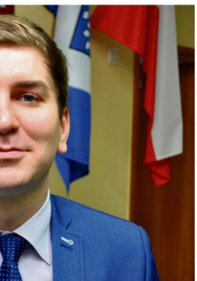
Jeden z najmłodszych radnych Gminy Oświęcim stara się wsłuchiwać w problemy mieszkańców i skutecznie je rozwiązywać.

Radnego cieszy także zapowiedź montażu w tym roku sygnalizacji świetlnej na niebezpiecznym skrzyżowaniu ul. Zatorskiej, Chemików, Porębskiej