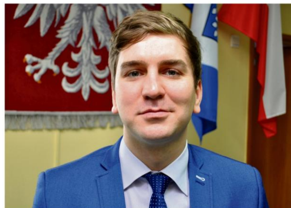
Jeden z najmłodszych radnych Gminy Oświęcim stara się wsłuchiwać w problemy mieszkańców i skutecznie je rozwiązywać.

wie długo oczekiwanej modernizacji ul. Pod Górką, Jezioro i Grojecka (droga powiatowa). To nie tylko owoc zabiegów politycznych. Starosta